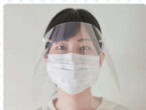
圧迫感の少ないデザイン