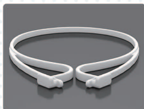
シンプルな軽量構造

多くの方と接するレジ担当者や、お客様との距離が近い美容室、医療従事者などの対面感染対策に！軽量 ABS のフレーム部分は、前頭部に直接触れず装着の煩わしさや圧迫感を低減しています。