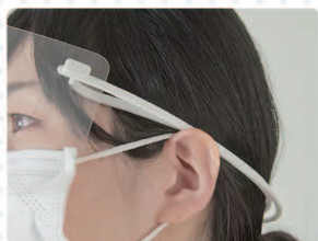
頭にフィットする優しいフォルム